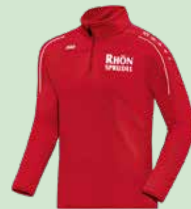
Farbe und Design sind nicht verbindlich!

Abschlusspreise gelten auch für Nordic-Walking!