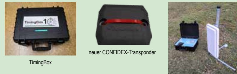
TimingBox, neuer CONFIDEX-Transponder, TimingBox mit Antenne

Der Rhön Super Cup e.V. möchte auch in den nächsten Jahren weiterhin in der Spitzenklasse der deutschen Laufserien mitmischen und hofft auf Eure Unterstützung.