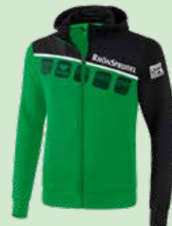
Farbe und Design sind nicht verbindlich!